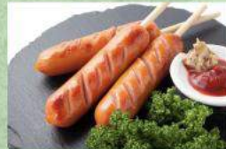
中村青年会議所(JC) フランクフルト・ソフトドリンク