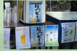
中村商工会議所青年部(YEG) 生ビール・ハイボール・ジュース アイスクリン