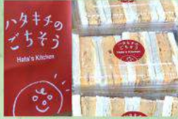
鎌田製菓の食パン & Hata's Kitchen 厚焼玉子サンド