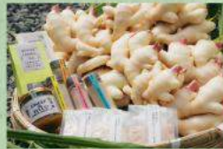
山崎生姜農園 生姜のジャム、スパイス、紅茶