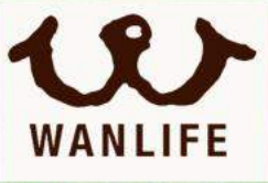
ワンライフ ハンバーガー

2023 10/29 Sun 10:00-16:00 場所 » 四万十川キャンプ場周辺