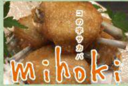
コの字サカバ mihoki 手羽先の一夜干しからあげ