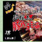
しまん豚 豚ハラミ串