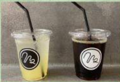
cafe n2 コーヒー・ソライロコーラ