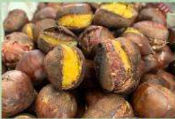
しまんと美野里 焼き栗