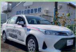
四万十自動車学校 子ども免許証発行 当日、入校受付で10,000円引き!