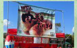
山貴 肉巻きおにぎり