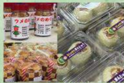
幡多農業高等学校 幡多農マルシェ