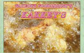
カッキーズ からあげ・たい焼き