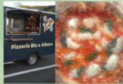
Pizzeria Blu e Albergo 窯焼ピザ