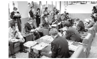
◀四万十市へ新型コロナウイルス感染症に関する要望